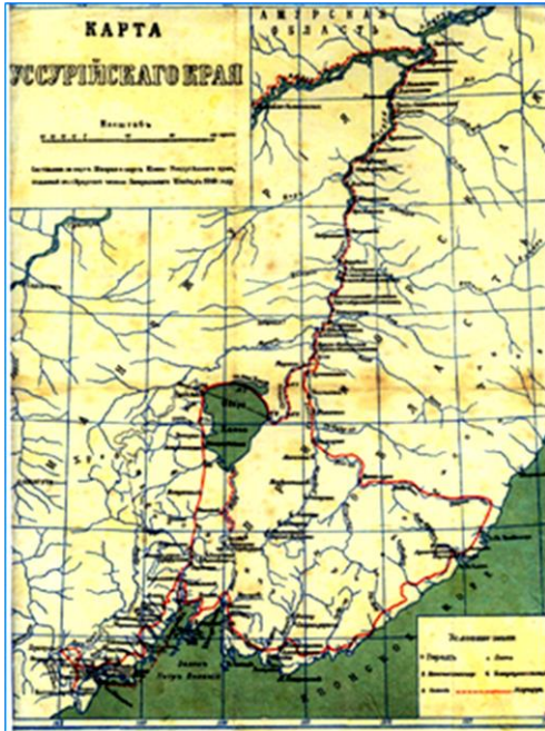
«Карта составленная чинами Генерального штаба в 1866 году»

Аборигенными названиями обозначены населённые места и географические объекты. Длительное время они неизменно привлекают внимание исследователей. Так, например, привычное название озера Ханка записано так: Кенгка.