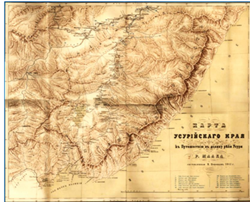
Карта Р. Маака

Названия рек, озёр и других географических объектов, данные народами, когда-то жившими на определённой территории, имеют важное значение для изучения исторической географии. Приморский край не является исключением: долгие годы сохранялись многие названия его мест и после того, как коренные народы покинули свои места обитания. Одна из первых географических карт, на которой изображены вновь присоединённые земли Южно-Уссурийского края – «Карта Уссурийского края к путешествию в долину реки Уссури Р. Маака, составленная М. Поповым в 1861 г.».